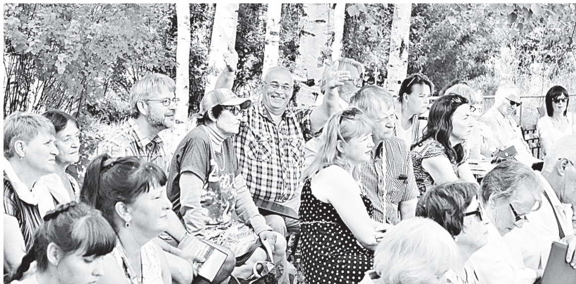
На фестиваль съезжались почитатели творчества Русакова из Санкт-Петербурга, Великого Новгорода и районов области

Светлана ИВАНОВА.