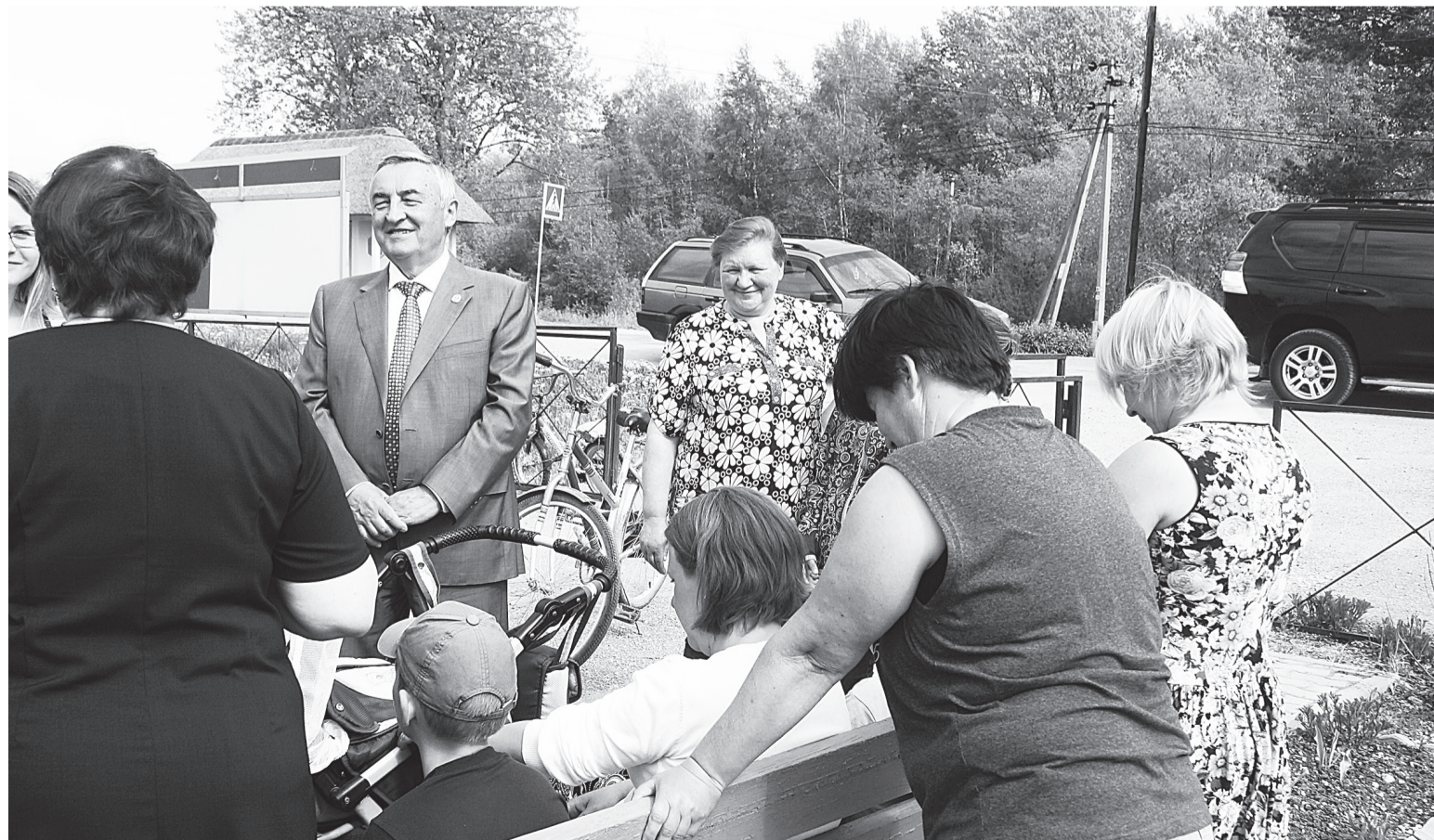
Взаимопонимание рождается в прямом диалоге